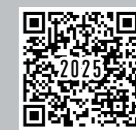
②プログラム申込/健康チェック(入力フォーム)